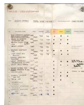
Rysunek 1. Przykład Hit List z obszaru produkcyjnego

Najpierw razem z Klientem tworzymy zestaw wiedzy, oparty na potrzebach organizacji - opracowujemy spersonalizowane szkolenie 5S. Następnie skupiamy się na zapewnieniu zasobów do realizacji procesu 5S. Tworzymy dedykowane punkty, które nazywamy magazynkami 5S - to miejsca, z których pracownicy mogą czerpać wszystkie kluczowe przedmioty, takie jak pojemniki, taśmy, markery czy narzędzia do sprzątania. Dodatkowo, wprowadzamy w życie Hit Listę - to zestawienie usprawnień, gdzie pracownicy mogą zapisywać swoje pomysły oraz zadania do realizacji. Ta lista jest dostępna w bliskim sąsiedztwie stanowisk pracy i regularnie omawiana na codziennych spotkaniach.