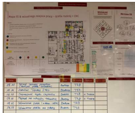
Rysunek 2. Wizualizacja 5S

Kolejnym krokiem jest wyznaczenie wydzielonego czasu na zaangażowanie się w działania związane z 5S - na przykład, rezerwując 2 godziny w tygodniu. W tym czasie pracownicy są zobowiązani do realizowania zadań z listy usprawnień. Mapa 5S to obszar, na którym poprzez oznaczenia w postaci kolorowych kropek śledzimy postęp prac w danym obszarze lub na stanowisku. W połączeniu z informacjami o statusach szkoleń i listą zadań, tworzy ona przestrzeń wspomagającą Lidera w zarządzaniu procesami związanymi z 5S.