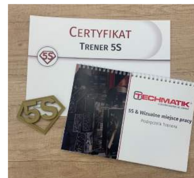
Rysunek 6. Certyfikat, odznaka i podręcznik Trenera 5S

Zwieńczeniem procesu certyfikacyjnego było uroczyste podsumowanie, które zgromadziło Zarząd, Kierowników oraz Mistrzów. Każdy z Mistrzów przedstawił wyniki swojej pracy podczas prezentacji, która ukazywała wprowadzone zmiany oraz udane praktyki wyłonione w toku procesu. Następnie wszyscy wspólnie udali się na Gemba Walk, aby osobiście zobaczyć usprawnienia w miejscach pracy oraz porozmawiać z Operatorami. Ostatecznym akcentem było uroczyste wręczenie certyfikatów wszystkim uczestnikom, poprzedzone wspólną celebracją przy słodkim poczęstunku.