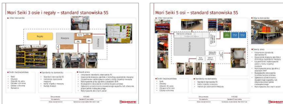
Rysunek 3 / 4. Przykłady standardów stanowisk