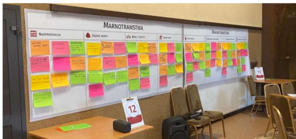
Rysunek 4. Przykład powstałej tablicy marnotrawstw