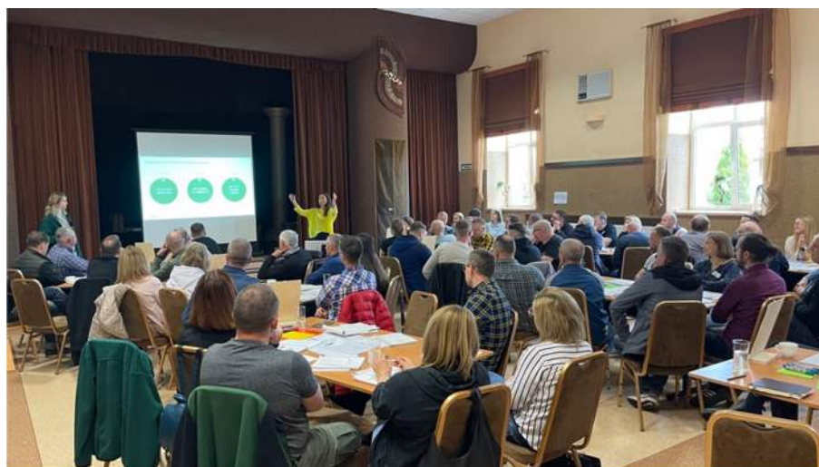
Rysunek 3. Rozpoczęcie Akademii Lidera Lean