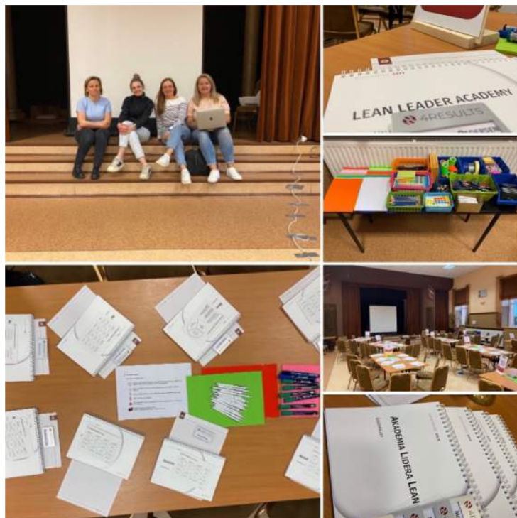
Rysunek 2. Przygotowanie do warsztatów