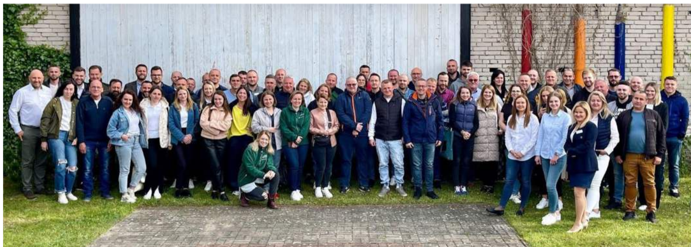
Rysunek 1. Uczestnicy Akademii Lidera Lean w Koczale

Celem każdego dnia Akademii było dostarczenie uczestnikom nowej wartości i angażującego doświadczenia. Zależało nam na zapewnieniu wysokiej efektywności tego szkolenia, dlatego skoncentrowaliśmy się na odpowiednim podejściu. Zastosowaliśmy proporcję 30% teorii i 70% praktyki, wzbogaconej o czas na refleksję i weryfikację zdobytej wiedzy. Takie podejście jest tym, czego oczekują uczestnicy najlepszych szkoleń i warsztatów, co zapewniło nam osiągnięcie naszych celów.