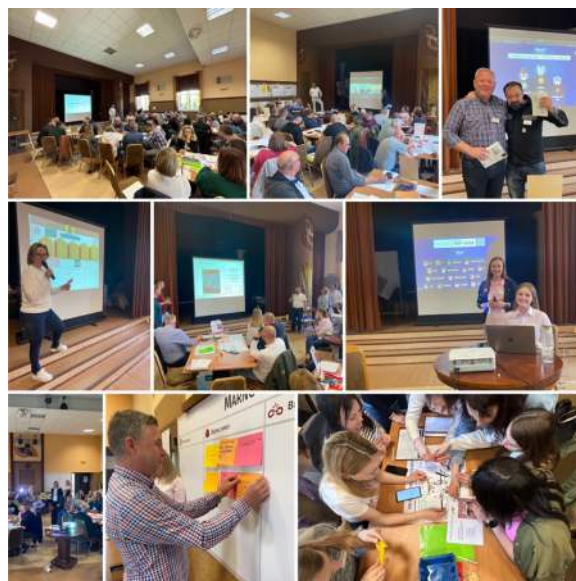
Rysunek 10. Uczestnicy podczas warsztatów

Na zakończenie Akademii każdy uczestnik otrzymał certyfikat potwierdzający ukończenie szkolenia. Dodatkowo, dostali kopertę do swojego listu z postanowieniami, którą mieli otworzyć 2 tygodnie po warsztatach. To było zobowiązanie, że każdy z nich sprawdzi, czy udało się wdrożyć zdobytą wiedzę i umiejętności w swojej pracy. To podsumowanie dodało uczestnikom motywacji do kontynuowania pracy nad doskonaleniem i wykorzystywaniem poznanych narzędzi w praktyce. Akademia zakończyła się sukcesem, a uczestnicy odebrali cenne narzędzia i wiedzę, które mogą skutecznie zastosować w swoich organizacjach i procesach zarządzania.