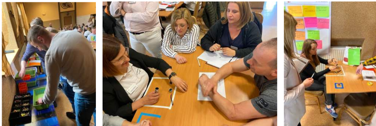
Rysunek 5 / 6 / 7. Symulacja „latarka”

To pierwszy etap Akademii, który dostarczył uczestnikom wiedzy i narzędzi potrzebnych do efektywnego działania. W kolejnych dniach szkolenia przyszedł czas na praktyczne ćwiczenia i dalszą naukę, a efekty tych działań zostaną omówione później w materiałach.