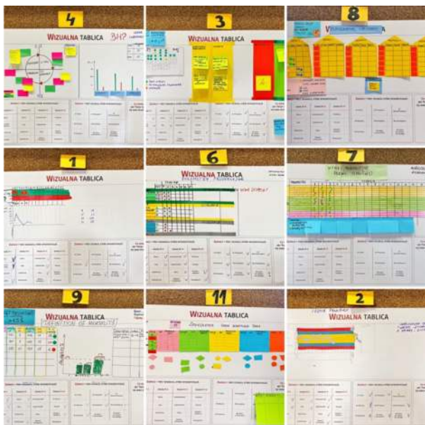
Rysunek 9. Wizualne tablice

Drugi dzień także zawierał case study, quiz wiedzy i refleksję. Tym razem prezentacje zespołów odbyły się na zakończenie, aby uczestnicy, po zdobyciu wiedzy, mogli sami ocenić, czy ich standardy są rzeczywiście wizualne i mają potencjał.